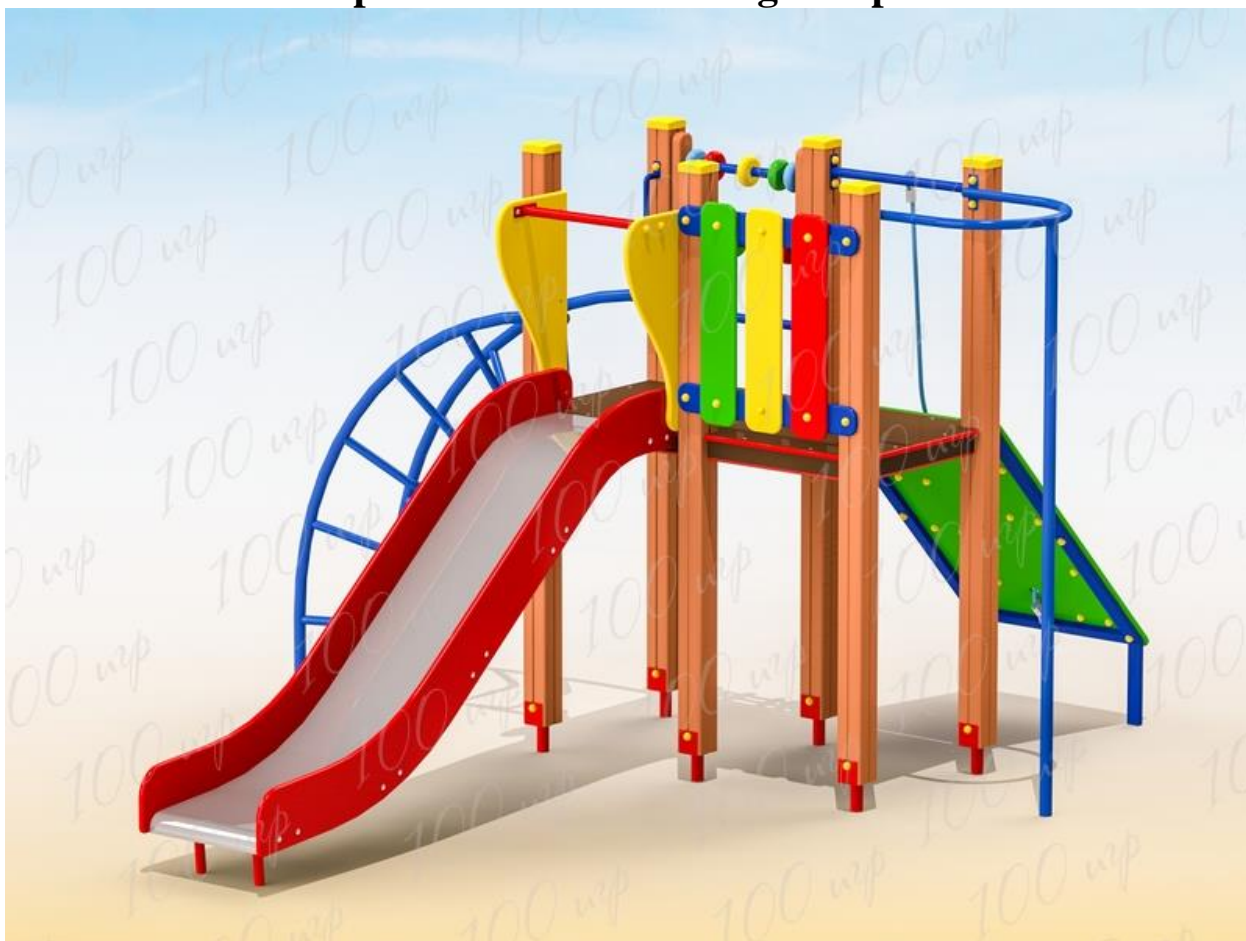
Equipment for children's playground