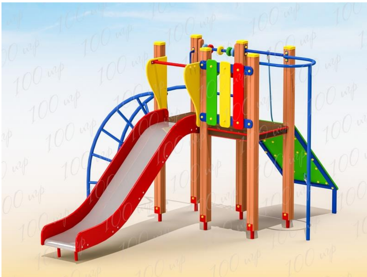
Оборудование для детской площадки